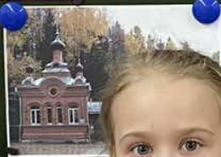
САВВИНА НА БЕЛЫХ В МОГИЛАХ