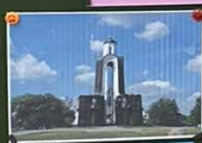
МЕМОРИАЛЬНЫЙ КОМПЛЕКС НА РЕЧНОМ ОСТРОВЕ