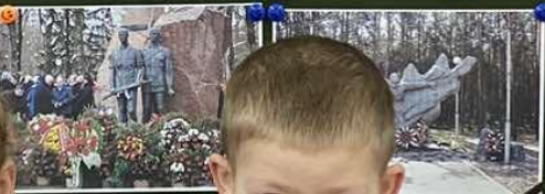
ГРОДНЕНСКИЙ СКВЕР ПАМЯТИ ВОЙНОВ-АФГАНЦЕВ