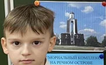
МЕМОРИАЛЬНЫЙ КОМПЛЕКС НА РЕЧНОМ ОСТРОВЕ